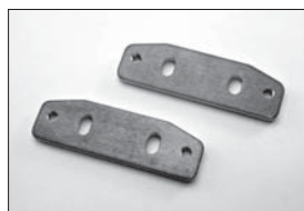
エンジンマウントスペーサー Engine Mount Spacer No.IF107 ★630