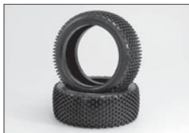
マイクロスクエアタイヤハイトラクション(ハード) Micro Square Tires High-traction (Hard) No.W5652H ★1995 マイクロスクエアタイヤハイトラクション(ソフト) Micro Square Tires High-traction (Soft) No.W5652S ★1995