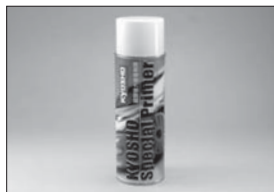
KYOSHOスペシャルプライマー(220ml) KYOSHO Special Primer (220ml) No.96155 ★2100