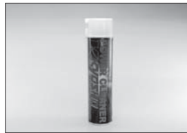
スーパーパワークリーナー Super Power Cleaner No.36901 ★882