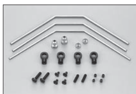
フロントスタビライザーセット Front Stabilizer Set No.IFW104 ●1050

フロントのロールを抑える Prevent chassis rolling of front.