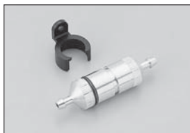
燃料フィルター Fuel Filter No.1876 ★1050 燃料のゴミをシャットアウト Shuts out dirt from fuel