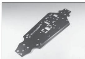
SPメインシャシー (S8・スポーツ用) Special Main Chassis (S8-MP7.5 Sports) No.GTW21 ★6090

※No.1190のワッシャーが必要。 *No.1190 (Washer) need this item.