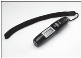
サーモメーター MINI Thermo Meter TN006 No.36207 ★2940

非接触型デジタル温度計 Noncontact digital thermometer