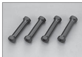
スペシャルメカポスト Special Radio Post No.IFW113 ★630