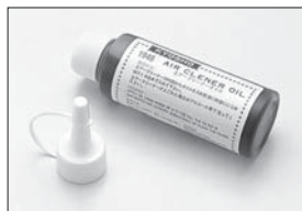
エアークリーナーオイル Air Cleaner Oil No.1948 ★1050