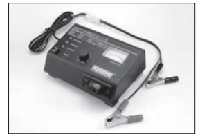
マルチチャージャーα 1-14 Multi Charger α 1-14 No.72551 ★10290