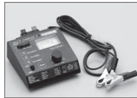
マルチチャージャー 4 Multi Charger 4 No.72511 ★5040