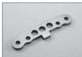
フロントロアサスプレート(ガンメタ) Front Lower Suspension Plate (Gun Metal) No.IFW127 ★1785