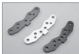
SPリヤロアサスプレート1° (レッド) SP Rear Lower Suspension Plate 1° (Red) No.IFW130 ★1575