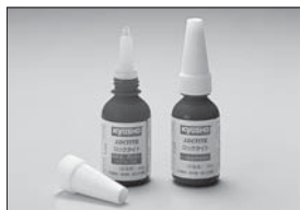
ロックタイト(中強度) Loctite (Medium Strength) No.94402 ★945 ロックタイト(高強度) Loctite (Strong Strength) No.94403 ★945 ネジの緩み防止 Screw cement.