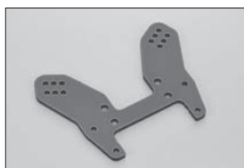
ハードダンパーステー (F) 7075S(ブルー) Hard Shock Stay (F) 7075S (Blue) No.IFW116BL ★2415