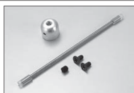
マフラステー Muffler Stay No.92511 ★630