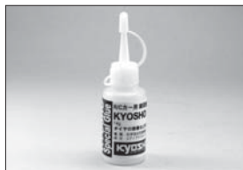
KYOSHOスペシャルグルー(14g) KYOSHO Special Glue (14g) No.96154 ★735