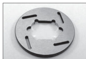
SPブレーキディスク SP Brake Disk No.IFW122 ★1890