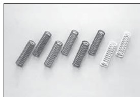
スプリング(S) レッド・スーパーソフト Spring (S) Red·Super Soft No.IFW32R ★945 スプリング(S) グリーン・ソフト Spring (S) Green·Soft No.IFW32GR ★945 スプリング(S) ブルー・ミディアム Spring (S) Blue·Medium No.IFW32BL ★945 スプリング(S) ホワイト・ハード Spring (S) White·Hard No.IFW32W ★945