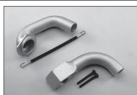
マニホールド(OS-RZ, ピコ, ノバロッジ) Manifold (OS-RZ, Picco, Nova Rossi) No.39514 ★3150