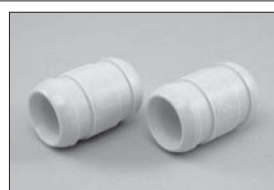
耐熱マフラージョイントパイプ Heat-resistant Muffler Joining Pipe No.92515 ★1050