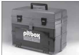
ピットボックス Pit Box No.1776 ★7140 工具収納に最適 Good for storing tools