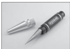
SPナイフエッジリーマー SP Knife Edge Reamer No.36219 ★1890 ボディの穴開けに最適 Best tool for holing bodies.