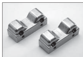
エンジンマウント Engine Mount No.IF108 ★630