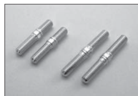
SPハードアッパーロッド(フロント用) SP Hard Upper Rod (Front) No.IFW123 ★1050