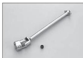
ユニバーサルセンターシャフト(フロント用) Universal Center Shaft (Front) No.IFW13 ★1680