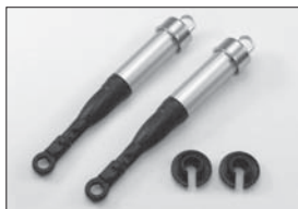
オイルダンパーセット(3.5mmシャフト フロント用) Oil Shock Set (3.5mm Shaft For Front) No.IFW140 ★4830 オイルダンパーセット(3.5mmシャフト リヤ用) Oil Shock Set (3.5mm Shaft For Rear) No.IFW141 ★4830