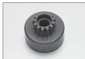
SPクラッチベル(13T) SP Clutch Bell (13T) No.IFW46 ★2310