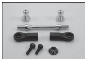
フロントトルクロッドセット Front Torque Rod Set No.IFW112 ★735