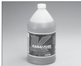
KANAI FUEL 30% Kyosho Racing KANAI FUEL 30% No.73112 ★5040