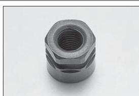
3PCフライホイールナット 3PC Flywheel Nut No.IFW54 ★368