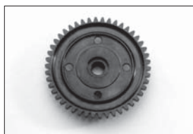
スパーギヤ(46T) Spur Gear (46T) No.IF105 ★1995