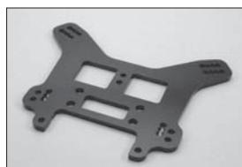
ハードリヤダンパーステー(7075S) (ブルー) Hard Rear Shock Stay (7075S) (Blue) No.IFW121BL ★2835