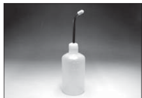
クイックフルポンプ(500cc) Quick Fill Fuel Bottle (500cc) No.96422B ★1050 給油ポンプ aid for fueling