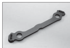
ステアリングプレート(ブルー) Steering Plate (Blue) No.IFW126BL ★1890