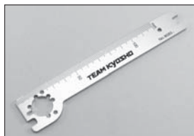
フライホイールレンチ Flywheel Wrench No.80951B ★1260 フライホイールの取外し用 Wrench Set.