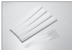
インナー スポンジ(ローハイト) Inner Sponge (Low-hight) No.W5035 ★1365 インナー スポンジ(ラウンドタイプ) Inner Sponge (Round Type) No.W5039 ★1365 インナー スポンジ(ハイハイト) Inner Sponge (High-hight) No.W5191 ★1365