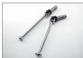
ユニバーサルスイングシャフト Universal Swingshaft No.IF125 ●3360