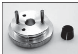
34mmフライホイール(2P用) 34mm Flywheel (for 2P) No.IF109 ★1575