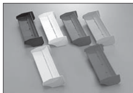
カラーナイロンウィング Color Nylon Wing カラーナイロンウィング(ホワイト) Color Nylon Wing (White) No.BSW71W ★1050