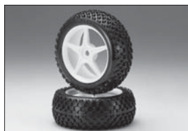
Xパターンタイヤハイトラクション(ハード) X-Pattern Tire High-traction (Hard) No.W5648H ★2100 Xパターンタイヤハイトラクション(ソフト) X-Pattern Tire High-traction (Soft) No.W5648S ★2100 C-Gripタイヤ S ※ホイールは C-Grip Tire S 付属しません。 No.W5648S-C ★2625 Wheels are not included.