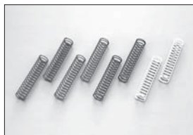
スプリング(L) レッド・スーパーソフト Spring (L) Red·Super Soft No.IFW33R ★945 スプリング(L) グリーン・ソフト Spring (L) Green·Soft No.IFW33GR ★945 スプリング(L) ブルー・ミディアム Spring (L) Blue·Medium No.IFW33BL ★945 スプリング(L) ホワイト・ハード Spring (L) White·Hard No.IFW33W ★945