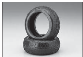
マイクロX SSタイヤハイトラクション Micro X SS Tire High-traction No.W5650SS ★2100 C-Gripタイヤ C-Grip Tire No.W5650SS-C ★2625