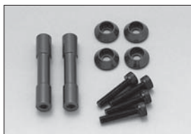
ウィングステーカラー Wing Stay Collar No.IFW7 ★945 アルミ製 Aluminum