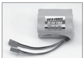
6V X-FORCE 1100ニカドバッテリー 6V X-FORCE 1100 Ni-Cd Battery No.71211 ★4200 受信機用電源 for receiver