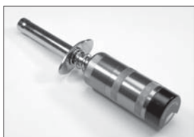
スパークブースター 2.0 (バッテリー付) Spark Booster 2.0 (Battery) No.36216 ★2730 スパークブースター 2.0 Spark Booster 2.0 No.36215 ★1890