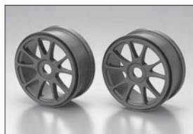
10スポークホイール 10-spoke Wheel 各4入り 4 each