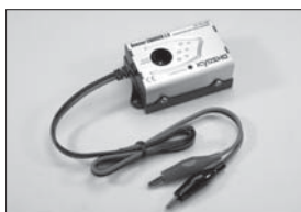
ブースターチャージャー 2.0 Booster Charger 2.0 No.36217 ★1995