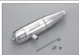
チューンドサイレンサー Tuned Silencer No.IFW37 ★7140