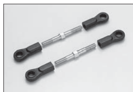
スペシャルタイロッド Special Tie Rod No.IFW2 ★630

※No.1190のワッシャーが必要。 *No.1190 (Washer) need this item.