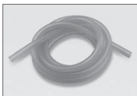
燃料チューブ(2.4x6x1000mm) Fuel Tube (2.4x6x1000mm) No.92213 ★735