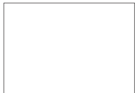
蛍光ストラップ(M) ピンク Fluorescent Strap (M) Pink No.1701KP ★263 蛍光ストラップ(M) イエロー Fluorescent Strap (M) Yellow No.1701KY ★263 蛍光ストラップ(L) ピンク Fluorescent Strap (L) Pink No.1702KP ★336 蛍光ストラップ(L) イエロー Fluorescent Strap (L) Yellow No.1702KY ★336